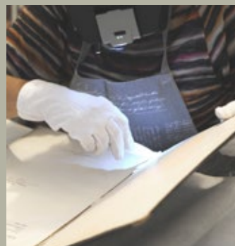
Tareas de limpieza y consolidación de material bibliográfico.