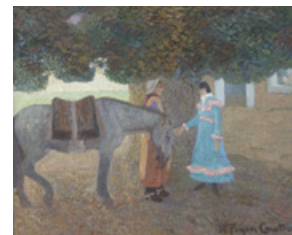
La despedida