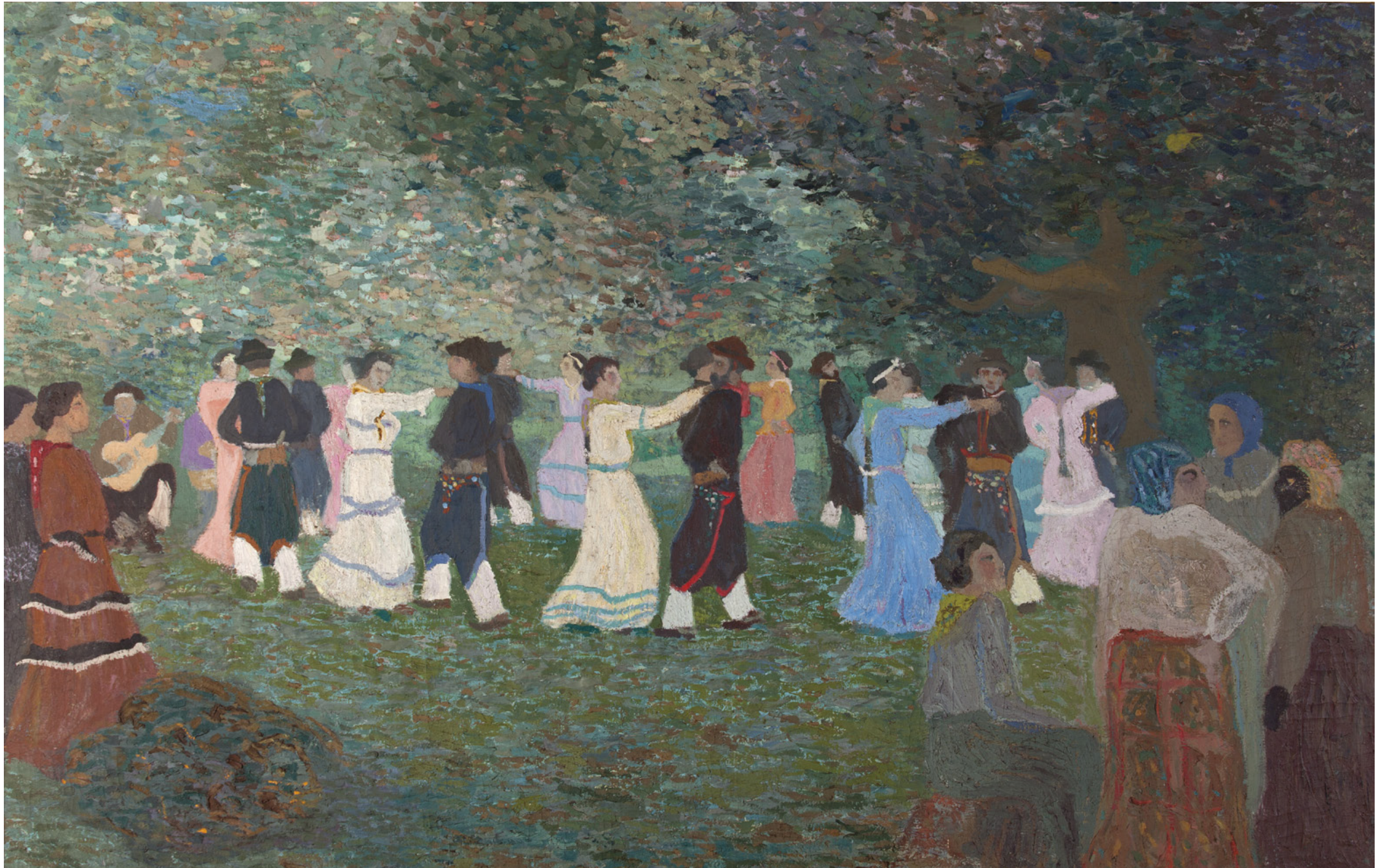
Juan Carlos Figari Castro Pericón en el bosque Óleo sobre tela, sin fecha. 89 x 139 cm / Colección Museo y Archivo Histórico Municipal, Cabildo de Montevideo