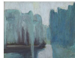
Sin título Colección Museo Figari