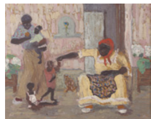
Los negritos Colección Cabildo de Montevideo

Otras pinturas de Juan Carlos Figari Castro: