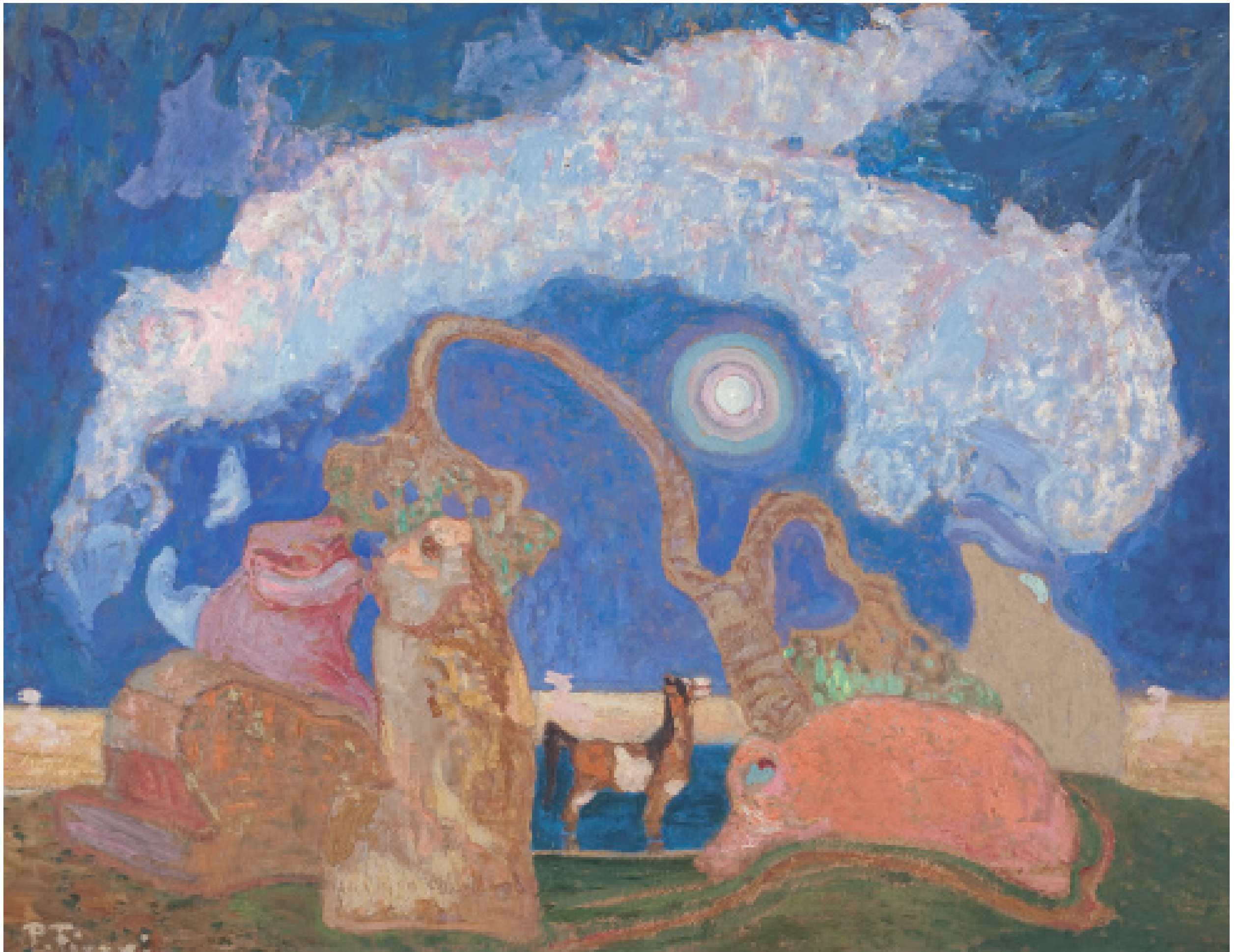
Pedro Figari Fantasía Óleo sobre cartón, sin fecha. 62 x 81 cm / Colección Museo Figari