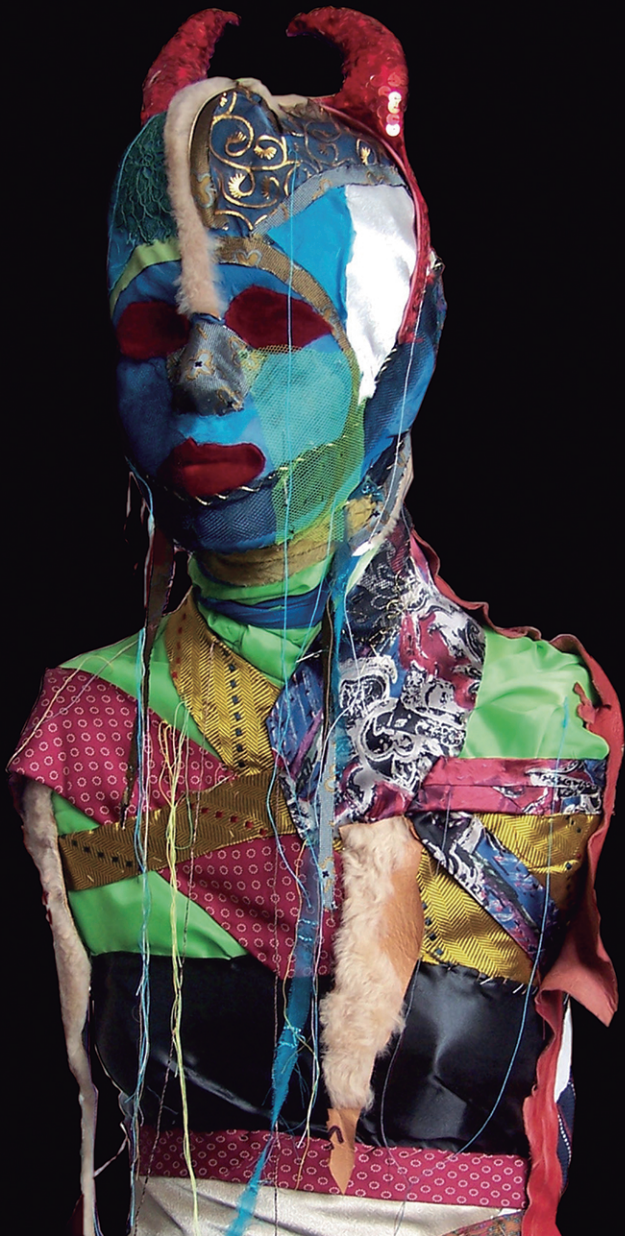
Sin título. Detalle de instalación. Pliegues, 2007