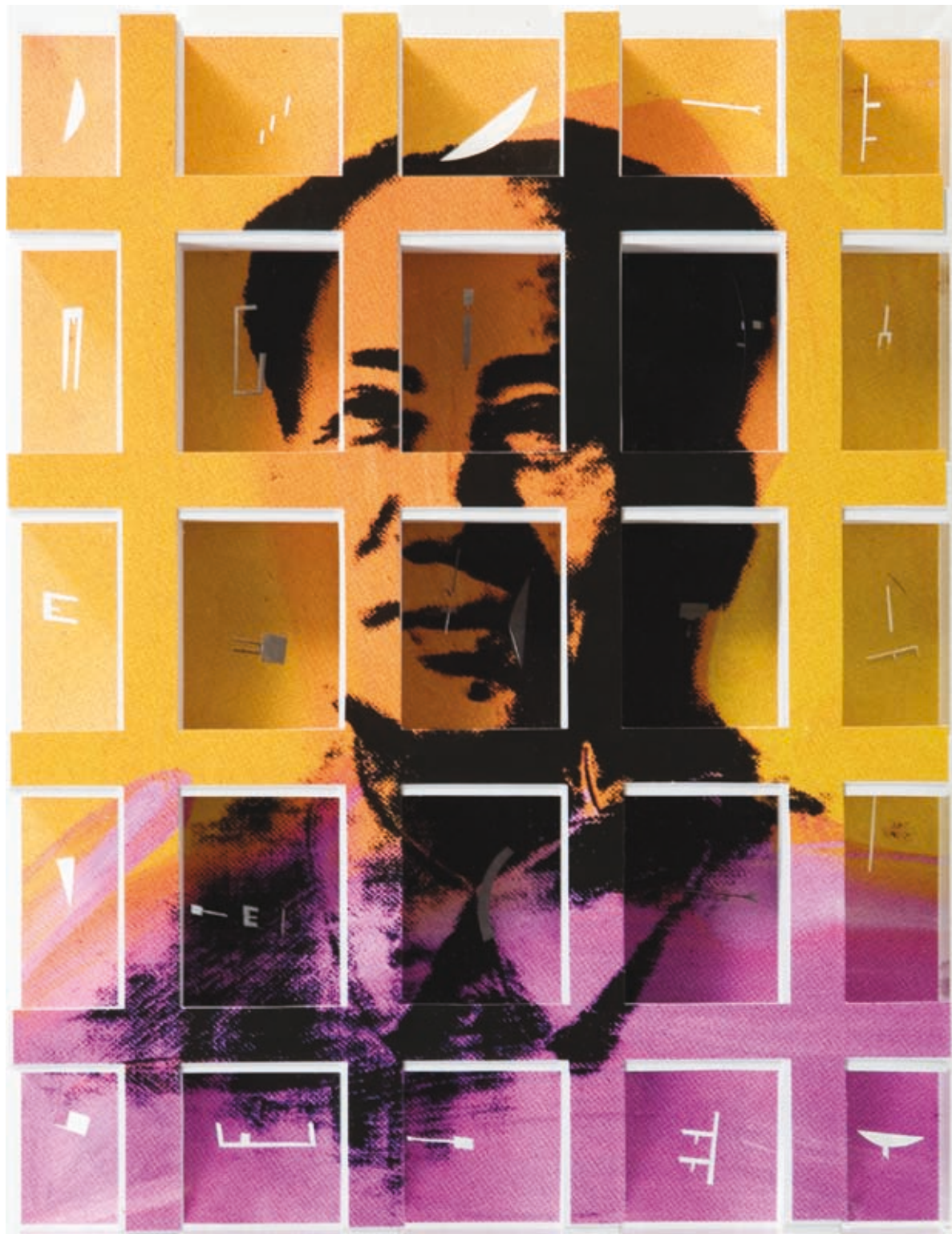
^ Marco Maggi 2010, Cobertura Completa sobre Warhol (Mao) Cortes sobre 500 hojas tamaño carta 22 x 28 x 5 centímetros.