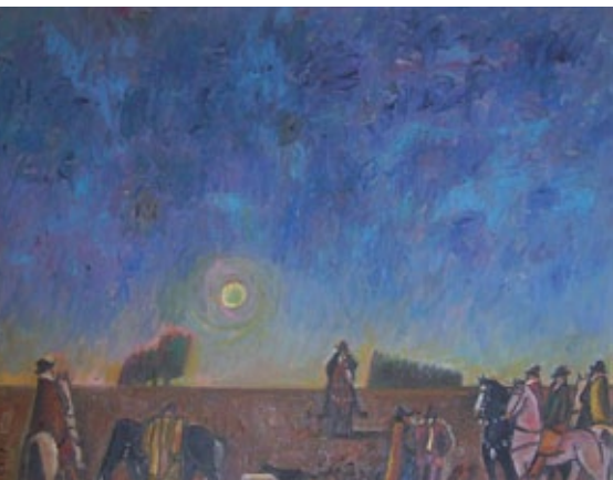
Juan Storm La penca Óleo sobre tela 77 x 97 cm 1989 Colección Juan Storm hijo