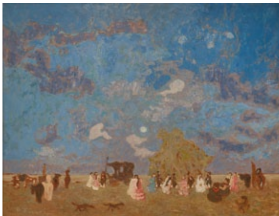
Pedro Figari Pique-nique Óleo sobre cartón 65 x 88 cm 1925 Colección Museo Nacional de Artes Visuales

E l ciclo de exposiciones denominado “Contactos” busca establecer vínculos entre la obra de Pedro Figari y distintas producciones artísticas de la región. Pedro Figari no dejó discípulos, con la salvedad de sus dos años como director al frente de la Escuela Nacional de Artes y Oficios; tampoco forjó una escuela pictórica. Desde el año 1917 pintó en compañía de su hijo y colaborador Juan Carlos hasta el fallecimiento de éste en 1927, y luego se entregó a la creación en la soledad de su taller parisino y más ocasionalmente, a su regreso en Uruguay, en la casa de su hijo menor Pedro.