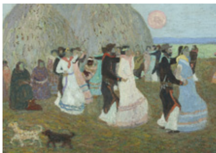
Pedro Figari Día de trilla (fragmento) Óleo sobre lienzo, 65 x 126 cm Colección Museo Histórico Nacional