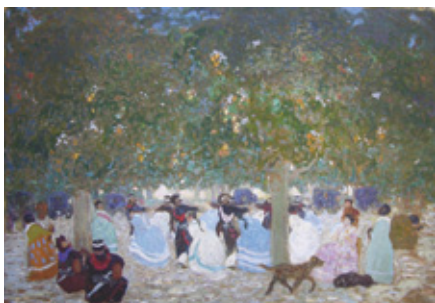
Pedro Figari Pericón bajo los naranjos Óleo sobre cartón, 70 x 100 cm Colección Fernando Saavedra

Para ello se vinculó a jóvenes liceales con la obra de Figari a través de juegos participativos que actuaron como disparadores de ideas, emociones, recuerdos o sentimientos que fueron emanando del contacto con la obra. A partir de técnicas de exploración del inconsciente, como la asociación libre desarrollada por Sigmund Freud, se recaba información para elaborar el contenido del 'letrero LED'. Este letrero -utilizado comúnmente en ambientes urbanos para difundir información corriente- contribuye a transportar a la obra de Figari al presente. Las frases y palabras surgidas a partir de la interacción de los jóvenes con la obra, invitan al espectador a reflexionar e interpelar las relaciones de los hombres con la naturaleza, del pasado con el presente y de los seres entre sí.