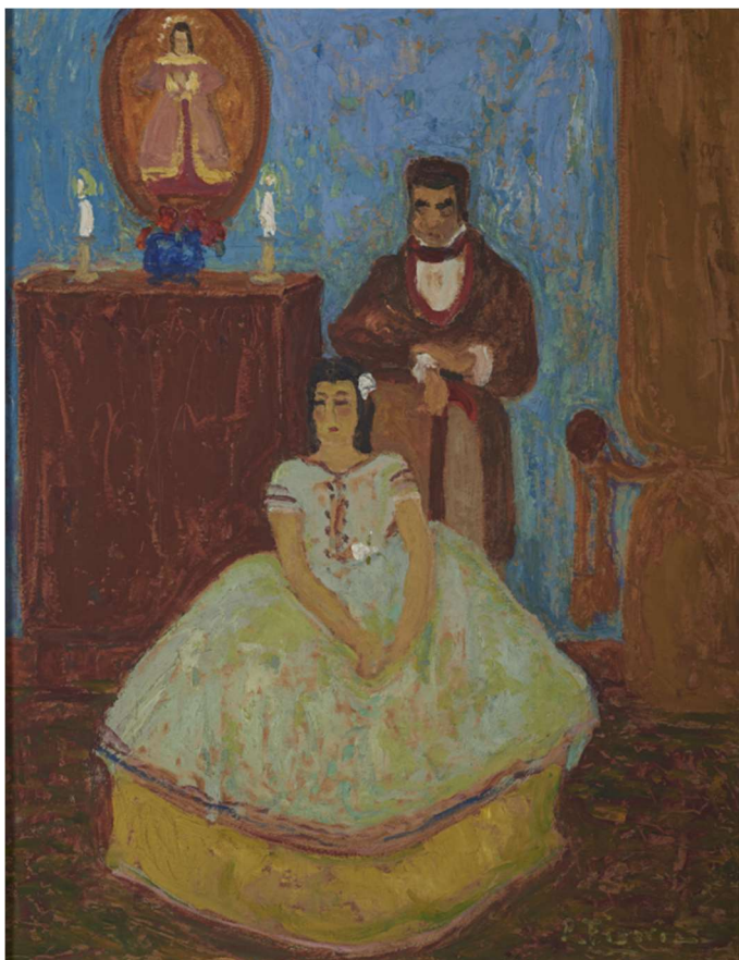
Pedro Figari. Después del entredicho , s/f. Óleo sobre cartón, 77,5 x 64 cm. Colección Museo Figari.