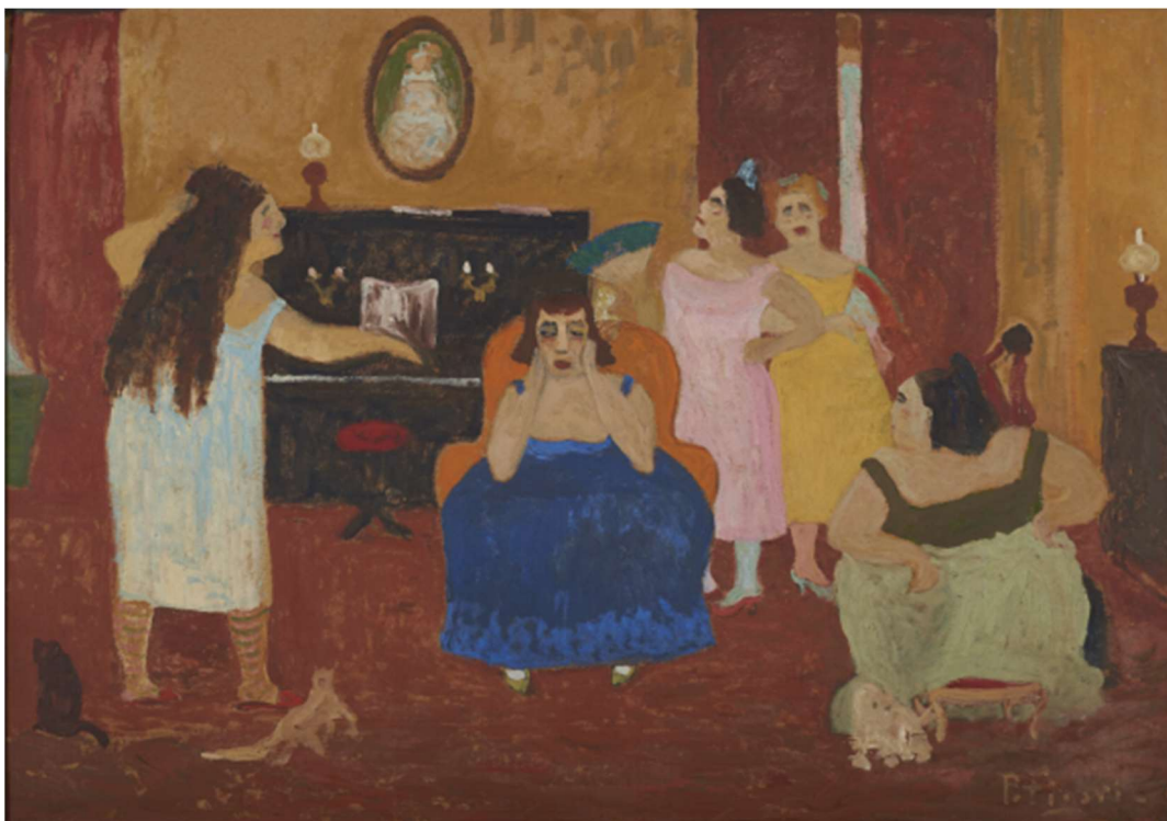
Pedro Figari. Arrepentimiento , s/f. Óleo sobre cartón, 70 x 100 cm. Colección Museo Figari.