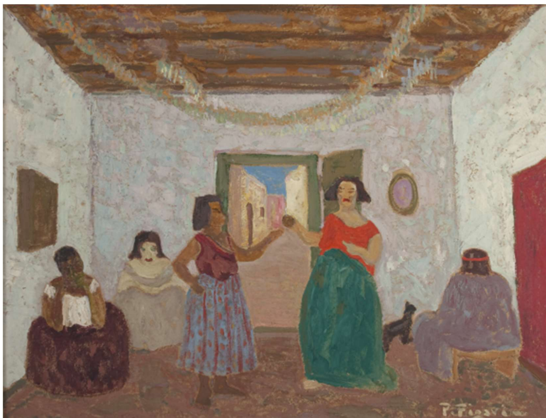
Pedro Figari. En el pueblo , s/f. Óleo sobre cartón, 62 x 82 cm. Colección Museo Figari.