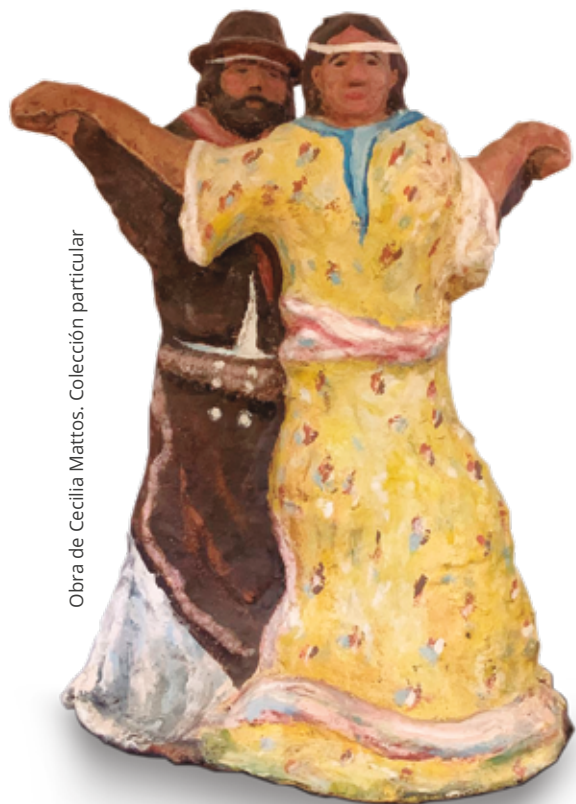
Obra de Cecilia Mattos. Colección particular

Por su sentido festivo e integrador, por la riqueza de sus figuras coreográficas, porque está atravesado por nociones de identidad, cultura y territorio, esta exposición propone acercarnos a las complejas tensiones históricas del pericón, a sus afectos y a sus alcances simbólicos menos evidentes.