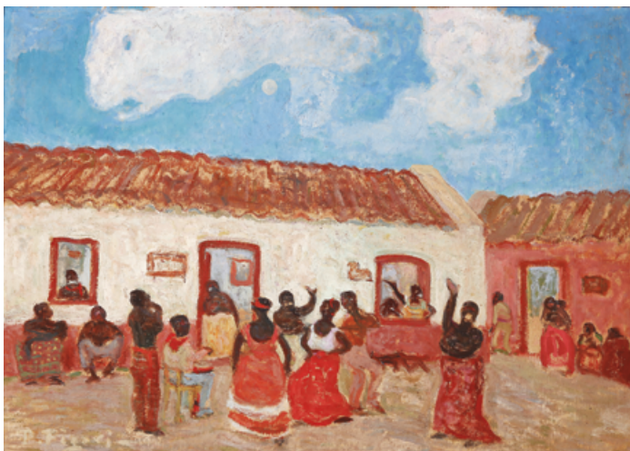
Pedro Figari Barrio de negros Óleo sobre cartón 50 x 70 cm Ca. 1924

Barrio de negros , óleo sobre cartón 50 x 70 cm, ca. 1924 / Bailongo , óleo sobre cartón, 63 x 83 cm. Ca. 1925 / Candombe , óleo sobre tela, 56 x 78 cm, 1921 / Candombe , óleo sobre cartón, 40 x 50 cm. S/f. Colección particular / Después de la visita , óleo sobre cartón, 48 x 63 cm, ca. 1927 / Cabaret , óleo sobre cartón, 50 x 70 cm. Ca. 1925-30 / Bailando , óleo sobre cartón, 24 x 63,5 cm. 1932 / Barrios bajos , óleo sobre cartón, 30 x 80 cm. Ca. 1922-25 / El consuelo , óleo sobre cartón, 49 x 60 cm. Ca. 1925-30 / Dama antigua , óleo sobre cartón 50 x 50 cm. Ca. 1923.