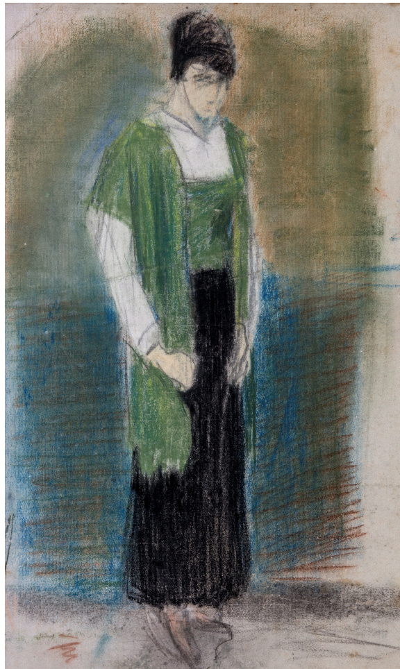
Obra restaurada

La obra debe conservarse tanto en sala como en depósito, colgada, a una temperatura entre 18 y 21 °C y una humedad relativa entre 45 y 60% evitando variaciones bruscas.